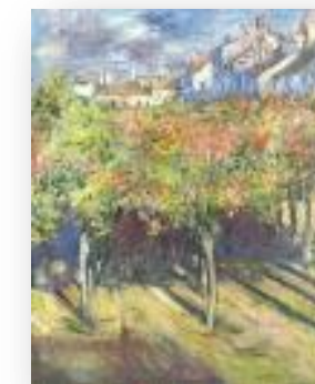
Les Tilleuls Claude Monet 1882

En partenariat avec l'association Eau et lumière qui œuvre pour l'inscription de l'impressionnisme au Patrimoine mondial de l'UNESCO, l'Office de Tourisme participe au 2 ème Estival des Impressionnistes.